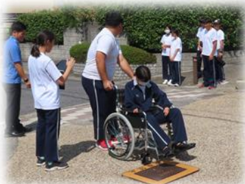
福祉 レクリエーション