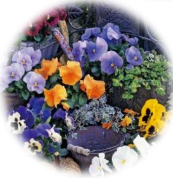
花苗(パンジーなど)